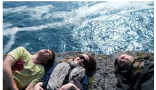
2c i Galway