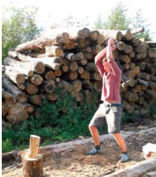
Fra årets intro tur

På Nørre G tilbyder vi flere forskellige lektiecaféer mandag og onsdag eftermiddag. Der er både fagfaglige caféer, hvor du kan få hjælp til matematik og sprog, og vi har caféer, der fokuserer på både skriftlighed og mundtlighed. Vores to læsevejledere giver dig metoder til at læse lektier mere effektivt.