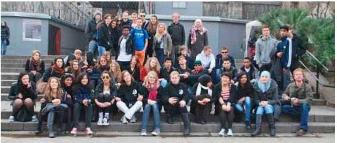
2i in Barcelona

Detailed information can be found on our homepage http://www.norreg.dk/ibdp (on IB DP) and http://www.norreg.dk/node/160 (on pre-IB).