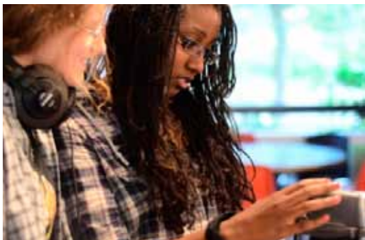
Mediefags elever på optagelse

Første skoledag var utrolig spændende. Man bliver taget rigtig godt imod og man får en masse nye venner både i og på tværs af klasserne.